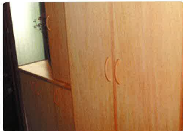
部屋の雰囲気洋服や、くつ、スカーフ、 その他色々収納したい。 奥行き違う収納がリズムカルに レイアウトされている