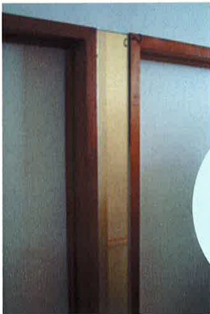
奥様の発想の転換 玄関わき内に付けず、 部屋の入口の間に つけた約10cm幅の鏡。 これがなかなか効いてます!