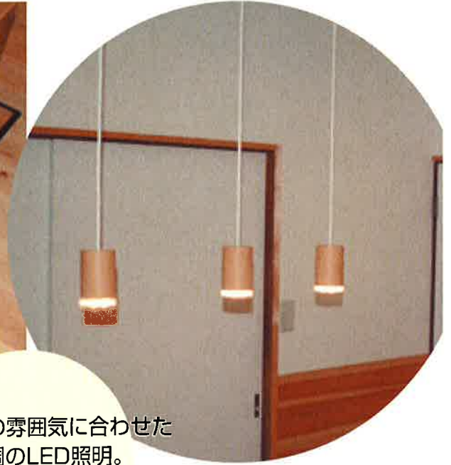
部屋の雰囲気に合わせて 木目調のLED照明。 団欒を照らす。