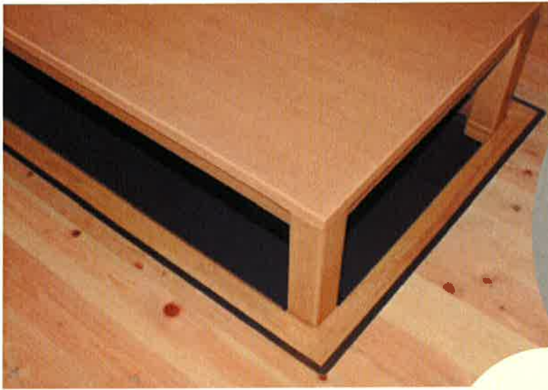
床下の有効利用! 掘りゴタツ風リビングテーブル。