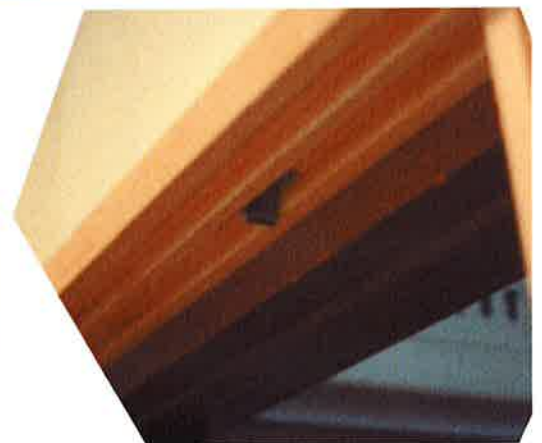
3枚の引戸を程よく止めるストッパー チョットした工夫で引戸の開け閉めが